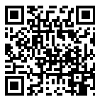
Подключение к облачному сервису